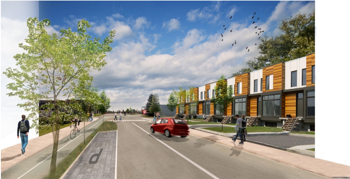
Image d'ambiance montrant une vue de la rue Sainte-Anne vers l'ouest avec piste cyclable, trottoirs élargis et encadrement bâti renforcé.

À l'est de la rue Saint-Pierre, des aménagements plus larges et mieux structurés, pour piétons et cyclistes, doivent prolonger cet axe jusqu'au boulevard Armand-Thériault et au centre commercial. Le projet de nouvelle façade du centre commercial sur le boulevard Armand-Thériault prend tout son sens lorsqu'on réalise qu'il s'inscrit à l'extrémité de ce lien est-ouest.