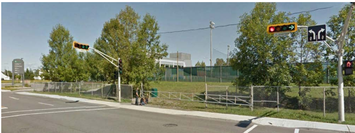
L'axe piétonnier et cyclable reliant le secteur commercial au pôle institutionnel et au centre-ville devrait être large, très visible et agréablement aménagé, ce qui n'est pas le cas actuellement.

L'élargissement du sentier piéton actuel nécessiterait de revoir certains éléments en place (gradins du terrain de baseball, débarcadère des autobus scolaires). À chaque extrémité de ce corridor, les intersections avec la rue Saint-Pierre et le boulevard Armand-Thériault doivent être revues pour les rendre plus sécuritaires, mais également pour rendre les aménagements pédestres et cyclables plus visibles et plus invitants.